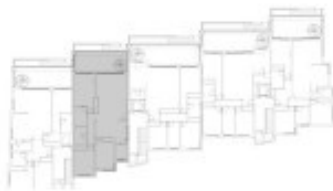
Plano de planta

OBSERVACIONES: El presente documento tiene carácter informativo y podrá experimentar ligeras variaciones por exigencias técnicas. El amueblamiento es orientativo y no está incluido en la venta. Las superficies indicadas son aproximadas.